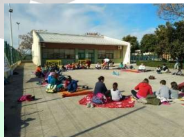
Celebración de las Fallas 2019