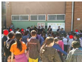
Escuela de familias: Mindfulness